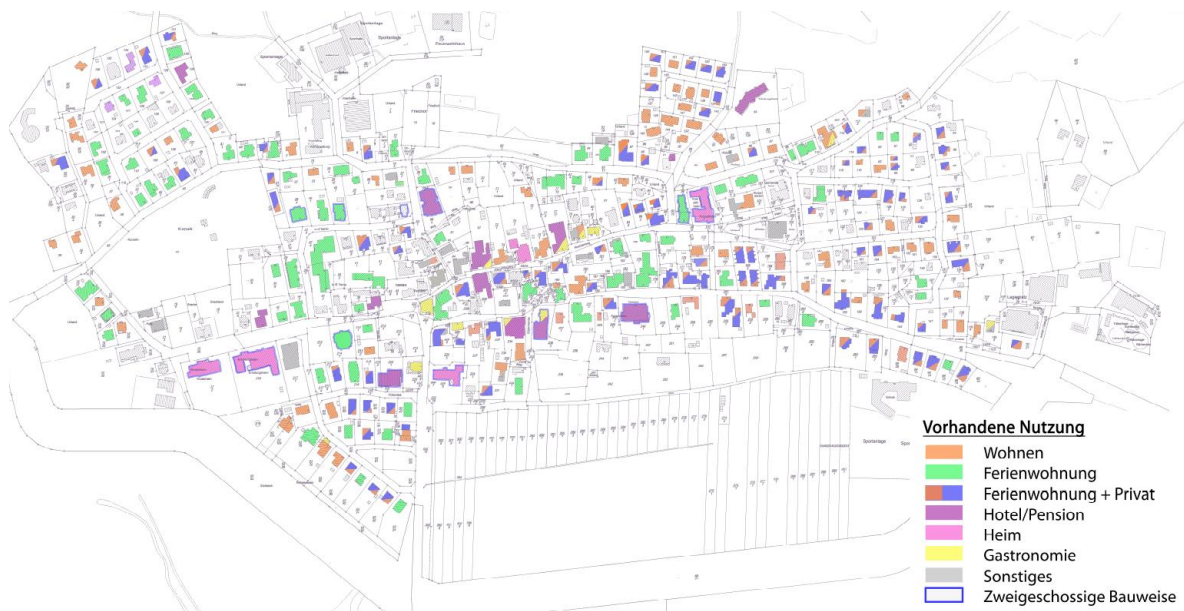
Abbildung 1: Real erkennbare Nutzungen

Bei dem Plangebiet handelt es sich um einen nahezu vollständig erschlossenen und bebauten Bereich, der sich in Art und Maß der baulichen Nutzung wie folgt darstellt: