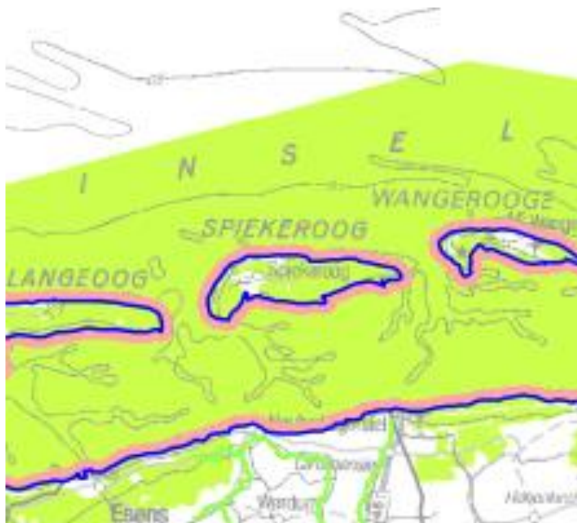
Abbildung 3: Auszug aus dem LROP

Das LROP Niedersachsen aus dem Jahre 2017 enthält keine der Planung entgegenstehenden Darstellungen. Der Ortskern ist nicht erfasst.